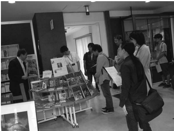
写真2 ギャラリートーク

およびそれらにまつわるエピソードをわかりやすく解説する構成としたが、「本の仕事原画展」の名のとおり「その人と本」と題して太宰治の「人間失格」や「ヴィヨンの妻」などを引用した解説に、参加者から多くの質問がなされていた。