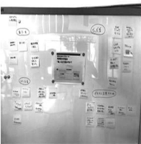
写真4 グループ分けしたアイデア