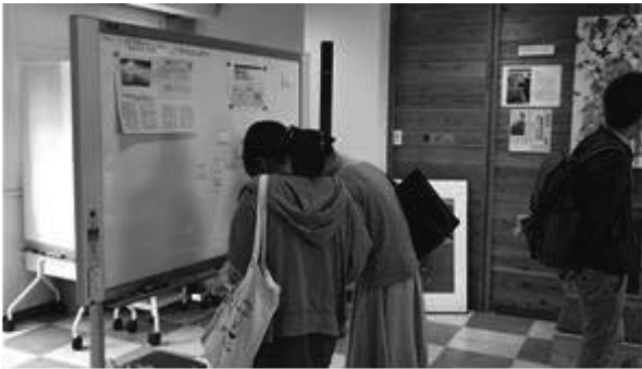
写真3 参加者による付箋でのアイデア出し

出されたアイデアを「展示系」、「イベント系」、「グッズ活用」、「その他」の4項目にグループ分けをした。