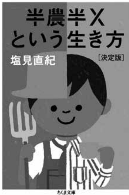
図1 『半農半Xという生き方』の書影