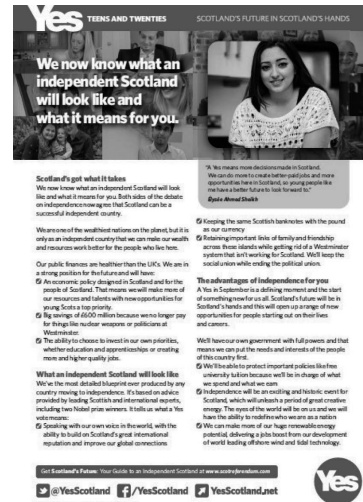
＜図2＞ Yes Scotland

このように，この2年間は独立住民投票に向けて，手続きが法的・行政的にも急速に進み，住民へ向けてのさまざまな文書や情報が発信され続けている。あらたに投票権が与えられた16～17歳の層もこの環境のなかになることになる。果たして，彼らはどのように受けとめているのだろうか。話題にしているのだろうか。これらの問いには後節で紹介する2013年に実施された意識調査結果が手がかりになる。