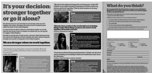
＜図1＞ Better Together

また，独立に反対するグループ（「Better Together」），SNPがベースとなる賛成するグループ（「Yes Scotland」）がそれぞれキャンペーンをおこなっている。前者は保守党，労働党，自民党が支持をしており，SNPとの対立の構図は容易に想像できる。図1と図2はキャンペーン用パンフレットである。各ウェブサイトでは連日の意見表明，ソーシャル・メディアによるコメント発信等のネット・キャンペーンが展開されている 9 。また，学校用教材パックの配布など，16～17歳へと拡大された有権者を意識した活動をおこなっている（TESS 13 September 2013）。