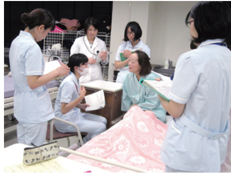
図2 SP参加型ロールプレイの様子

6～7人のグループ編成であり、教員1名がファシリテーター役割をとる。看護師役1名が演示し、残りの学生は観察役を行う。演示後は、患者（SP）→看護師役→観察役の順で振り返りを行う。